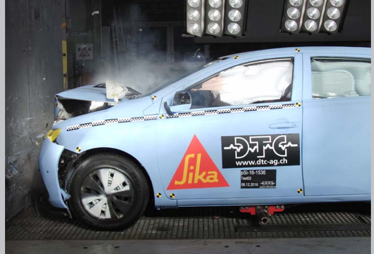
SIKA LASILIIMAUSMENETELMÄ TAKAA TURVALLISEN MATKAN.

SikaTack®-DRIVE:lla voidaan liimata käyttäen molempia Sikan menetelmiä. Sika Aktivator PRO -menetelmä mahdollistaa helpon ja luotettavan liimausmenetelmän tavanomaiselle lasinvaihdolle. Sika Primer-207 -menetelmällä varastointikulut pysyvät pienempänä käytettäessä ainoastaan yhtä tuotetta kaikissa työvaiheissa (kts. taulukko alla).